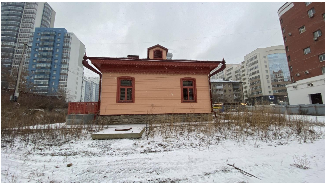
Фото 3. Вид на объект культурного наследия с внутриквартального пространства с востока.