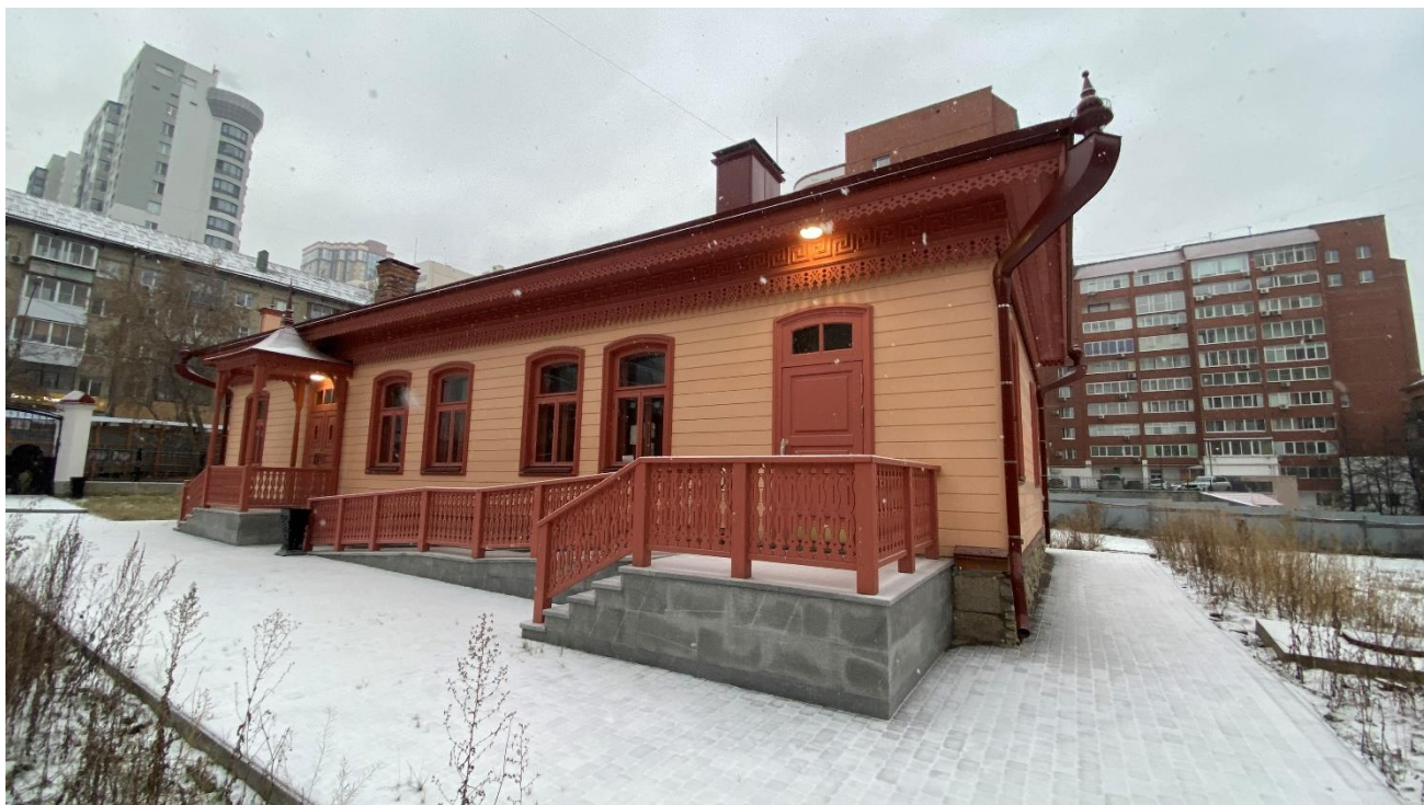
Фото 4. Вид на объект культурного наследия с внутриквартального пространства с юга.