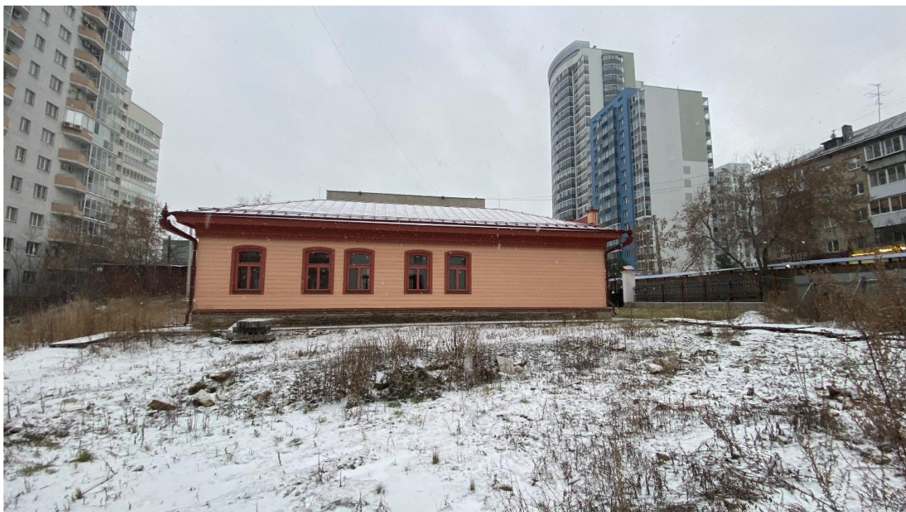
Фото 2. Вид на объект культурного наследия с внутриквартального пространства с севера.