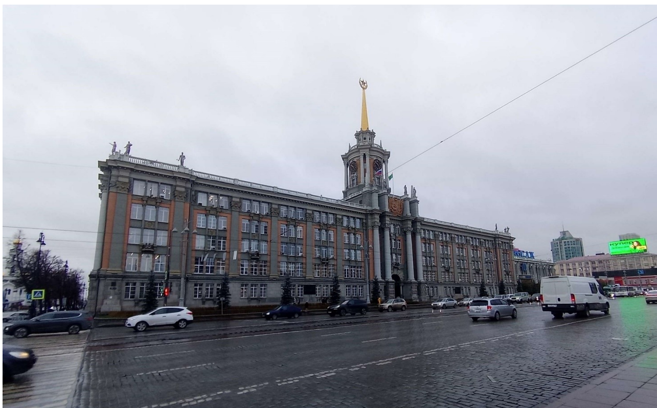
Фото 1. Объект культурного наследия регионального значения «Здание Горсовета» (Свердловская область, г. Екатеринбург, пр. Ленина, д.24-а)

Документы о постановке на охрану: Решение Свердловского облисполкома от 11.09.1980 № 16; Постановление Правительства Свердловской области от 29.10.2007 № 1056-ПП.