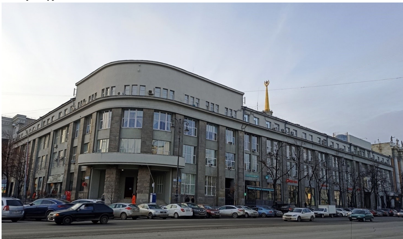
Фото 2. Объект культурного наследия регионального значения «Деловой дом» (Свердловская область, г. Екатеринбург, ул. 8 Марта, д. 8-б). [Источник: https://okn-mk.mkrf.ru/maps/show/id/5714253 . Дата обращения 20.03.2026]

Документы о постановке на охрану: Решение исполнительного комитета Свердловского областного Совета народных депутатов о взятии под государственную охрану памятников истории и культуры Свердловской области от 04.12.1986 № 454; Постановление Правительства Свердловской области о внесении изменений в описание объектов культурного наследия регионального (областного) значения, расположенных в городе Екатеринбурге от 29.10.2007 № 1056-ПП.