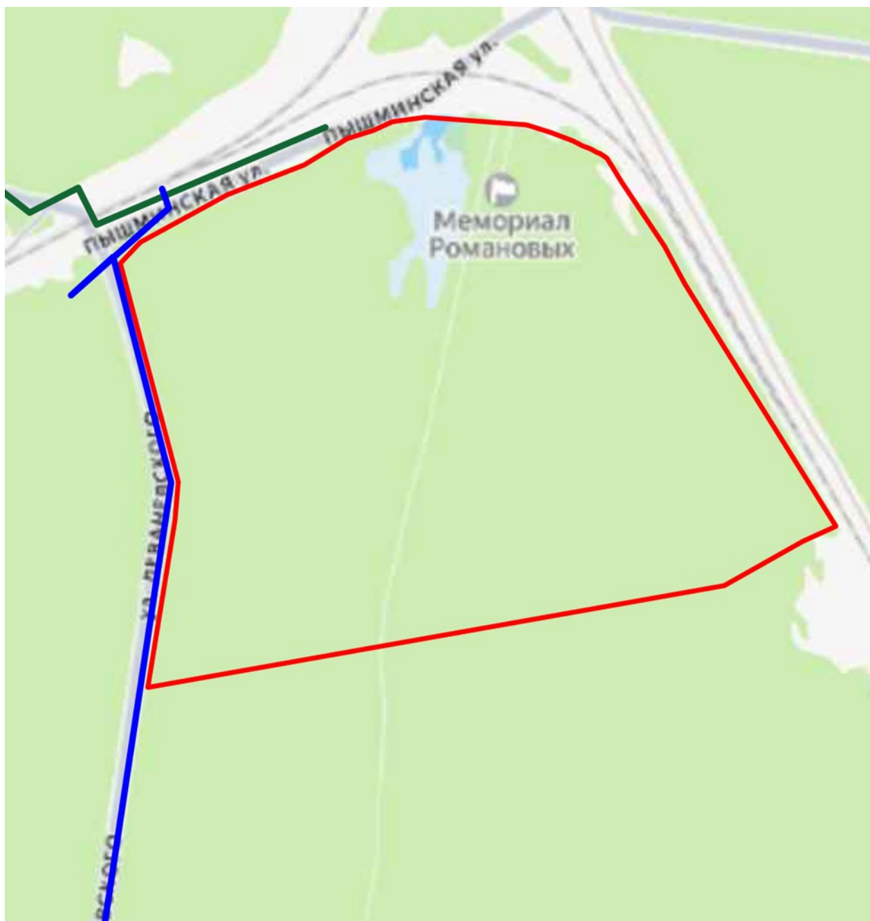
Схема границ территории объекта культурного наследия и план прокладки сетей электроосвещения (фрагмент).