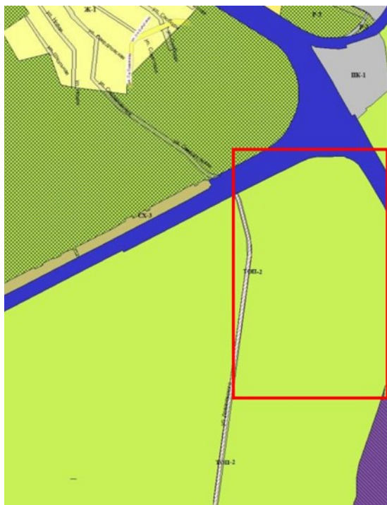
Карта градостроительного зонирования территории муниципального образования «город Екатеринбург».