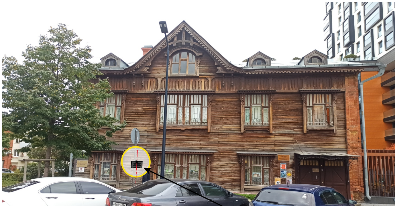
Общий вид памятника со стороны ул. Гоголя.