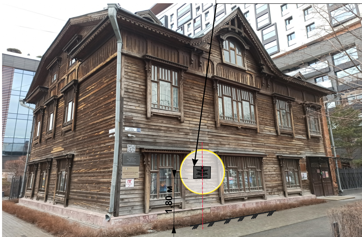
Фрагмент фасада со стороны ул. Гоголя.