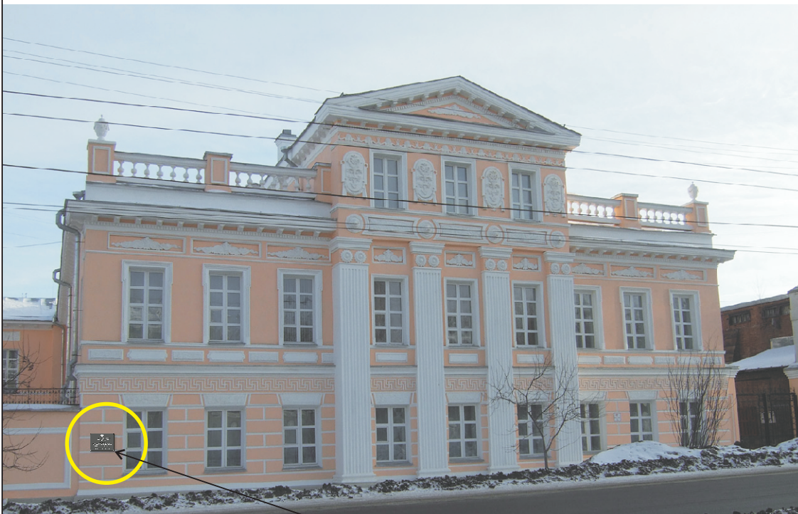
Место предполагаемого размещения информационной надписи