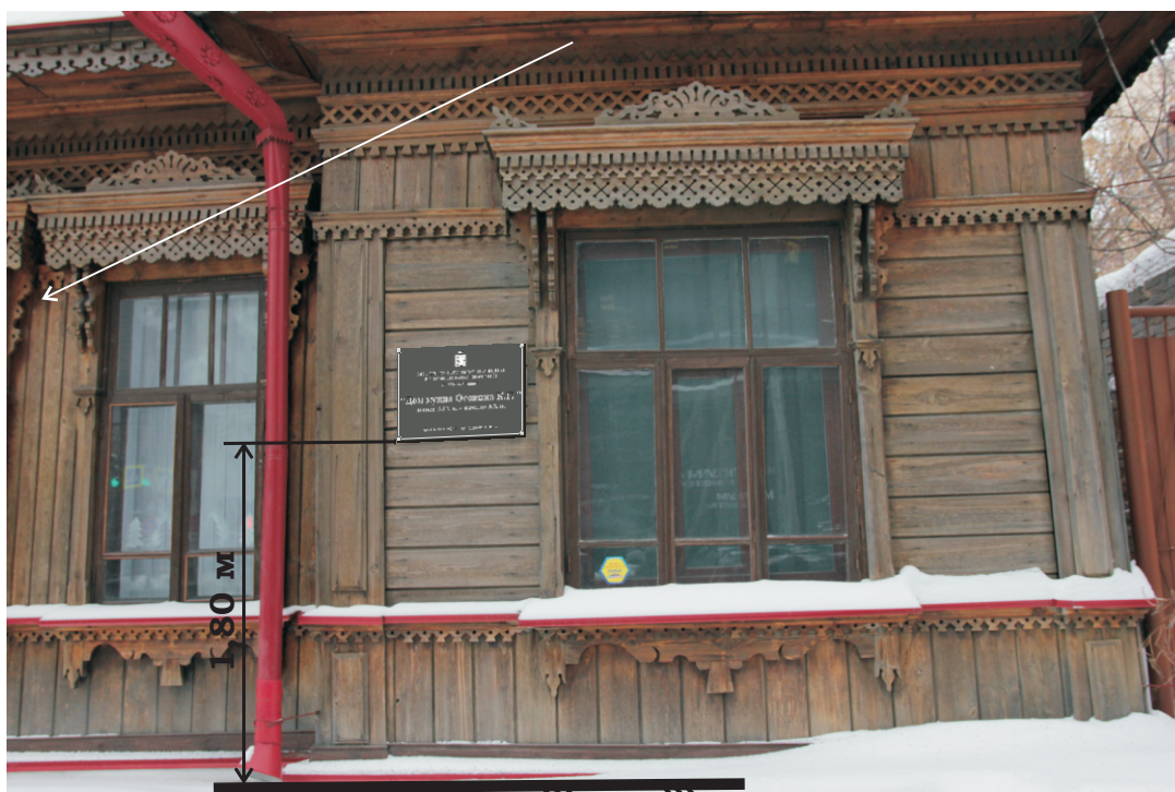
Вид со стороны ул. Р. Люксембург