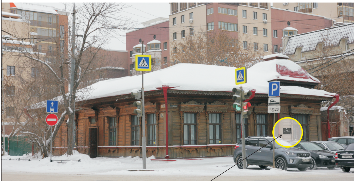
Общий вид со стороны перекрёстка Энгельса - Р.Люксембург