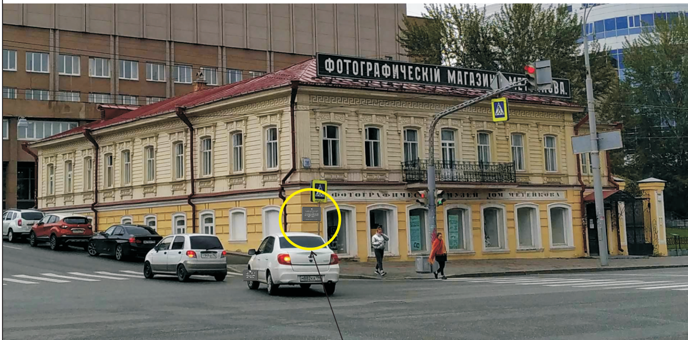
Место предполагаемого размещения информационной надписи