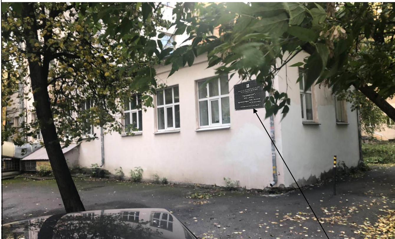
Место предполагаемого размещения информационной надписи