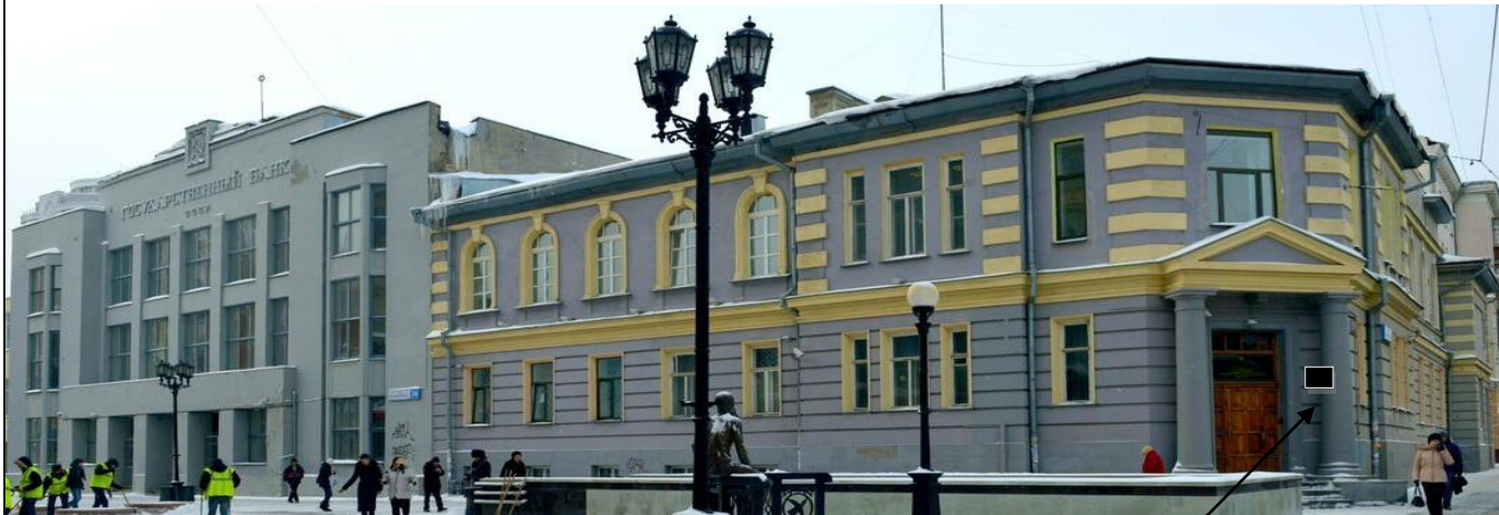
Место предполагаемого размещения информационной надписи