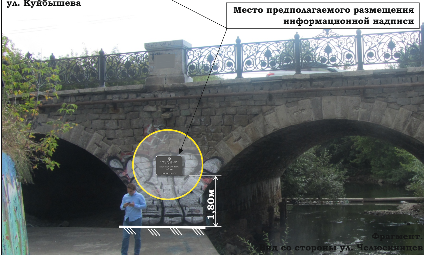
Место предполагаемого размещения информационной надписи