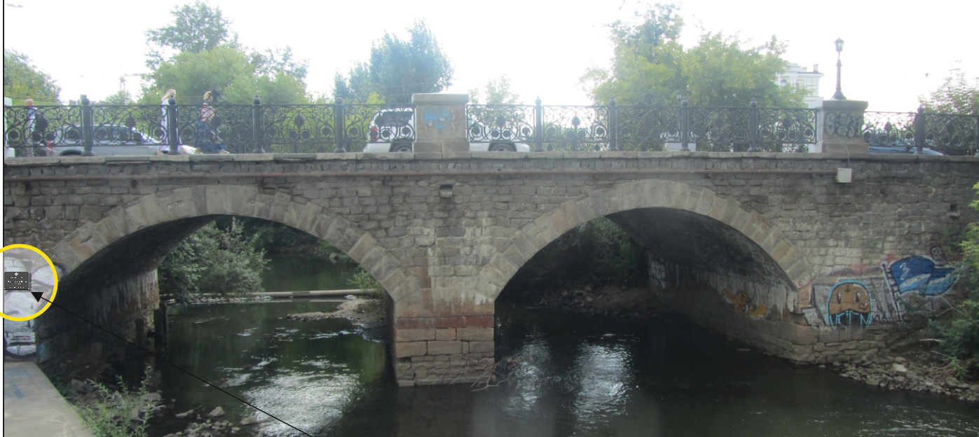
Общий вид со стороны ул. Куйбышева