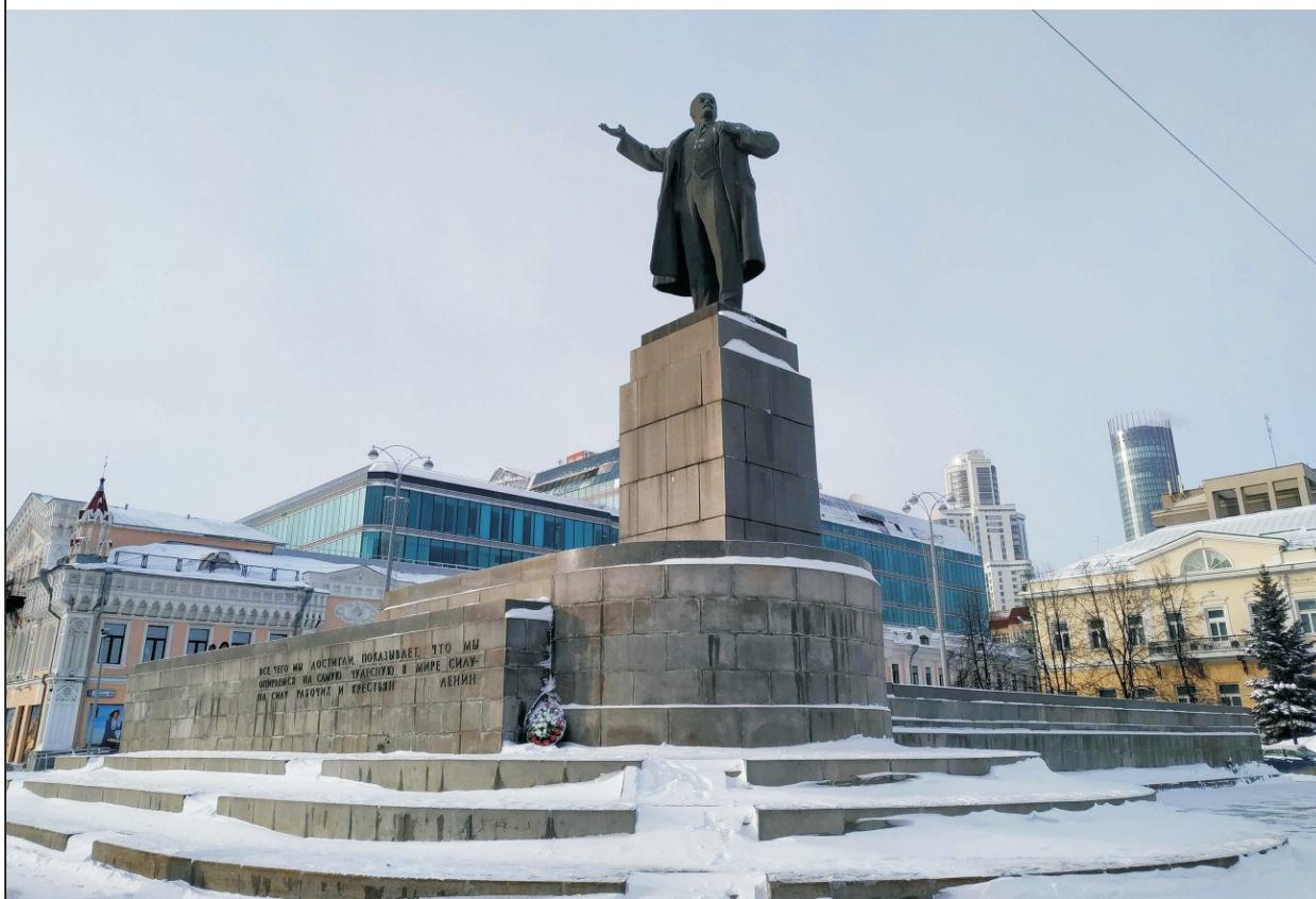
Общий вид (со стороны пл. 1905 года)

Место предполагаемого размещения информационной надписи