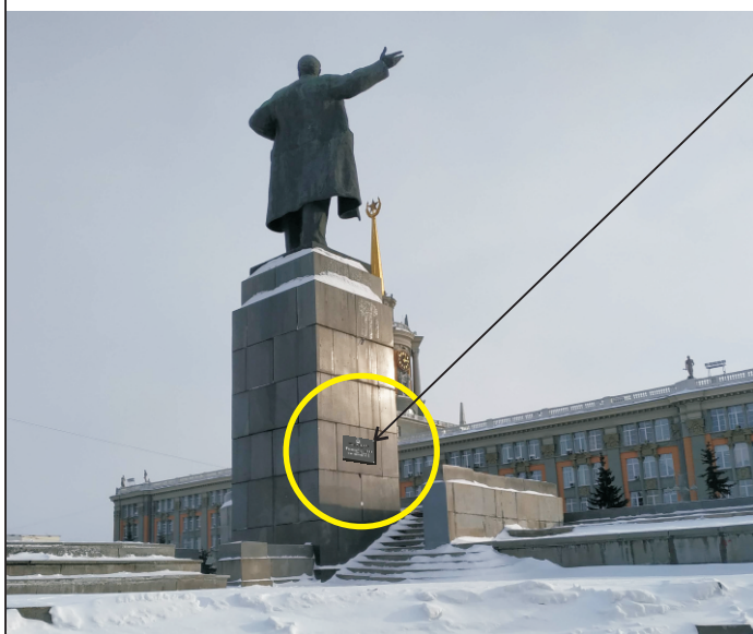
Вид со стороны ул. Урицкого

Место предполагаемого размещения информационной надписи