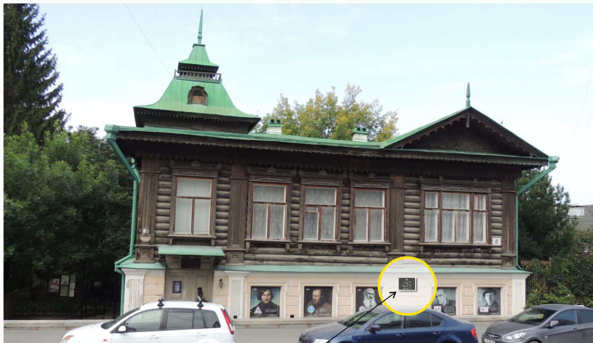
Общий вид с улицы Толмачева (Царская).

Место предполагаемого размещения информационной надписи