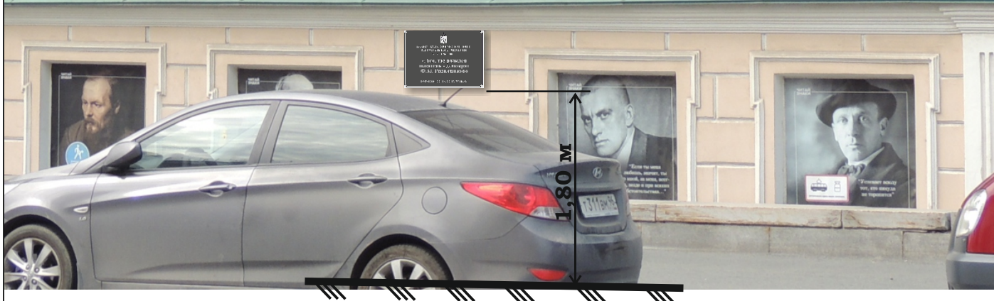
Фрагмент фасада с улицы Толмачева (Царская).