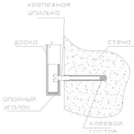
Рисунок 1. Схема установки шпильки