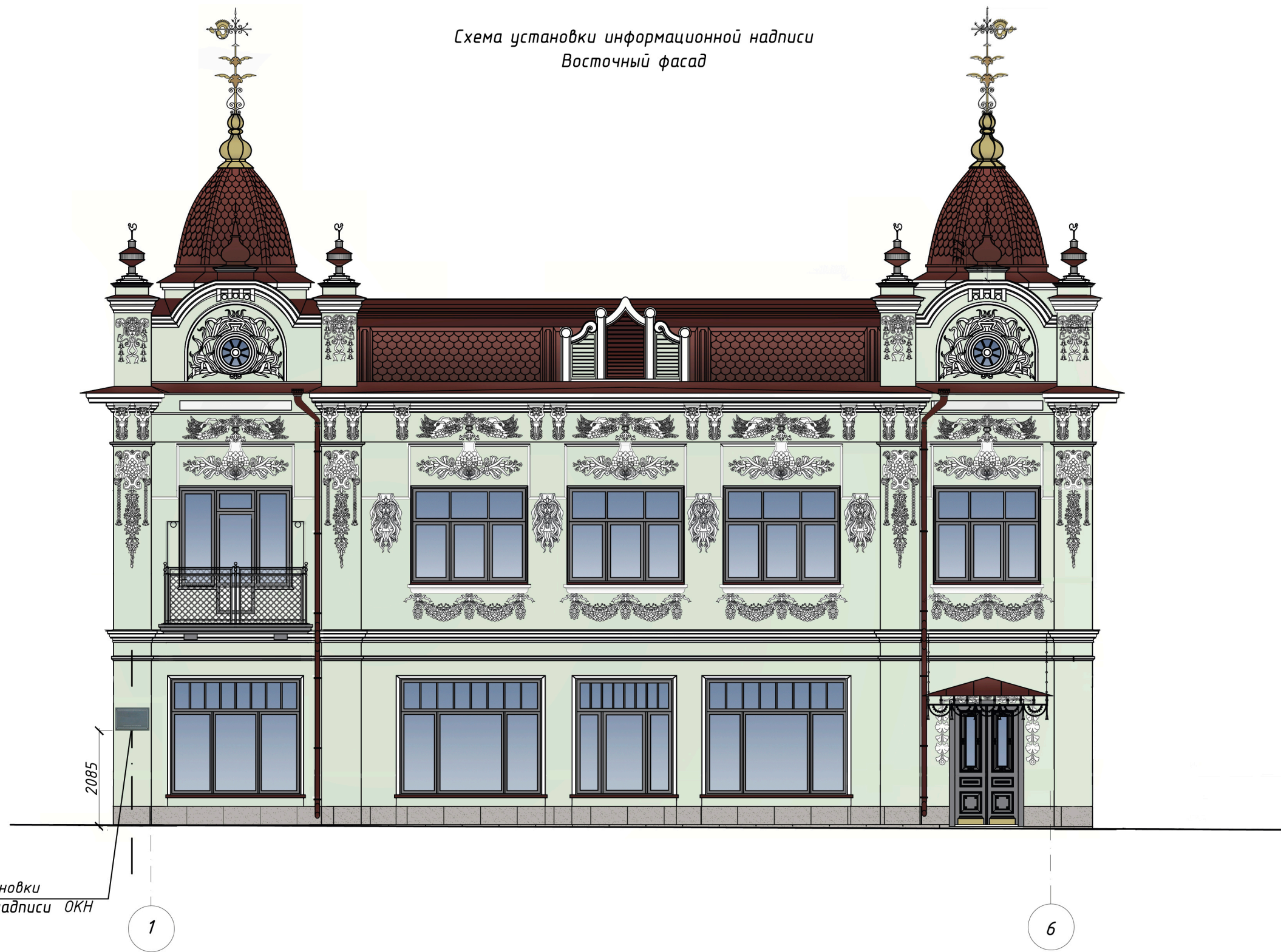
Схема установки информационной надписи Восточный фасад

Место установки информационной надписи ОКН