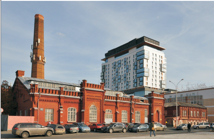
Общий вид ансамбля