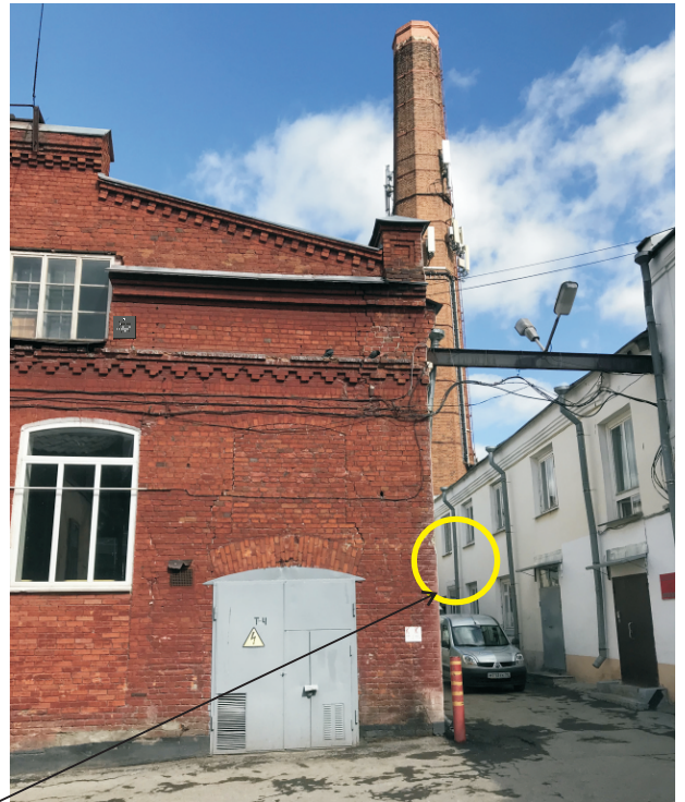
Место предполагаемого размещения информационной надписи