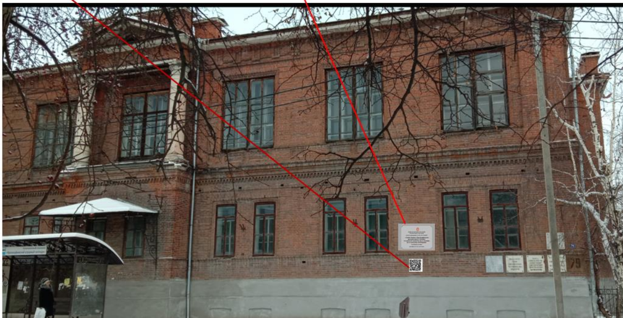
Вид здания со стороны улицы Ленина