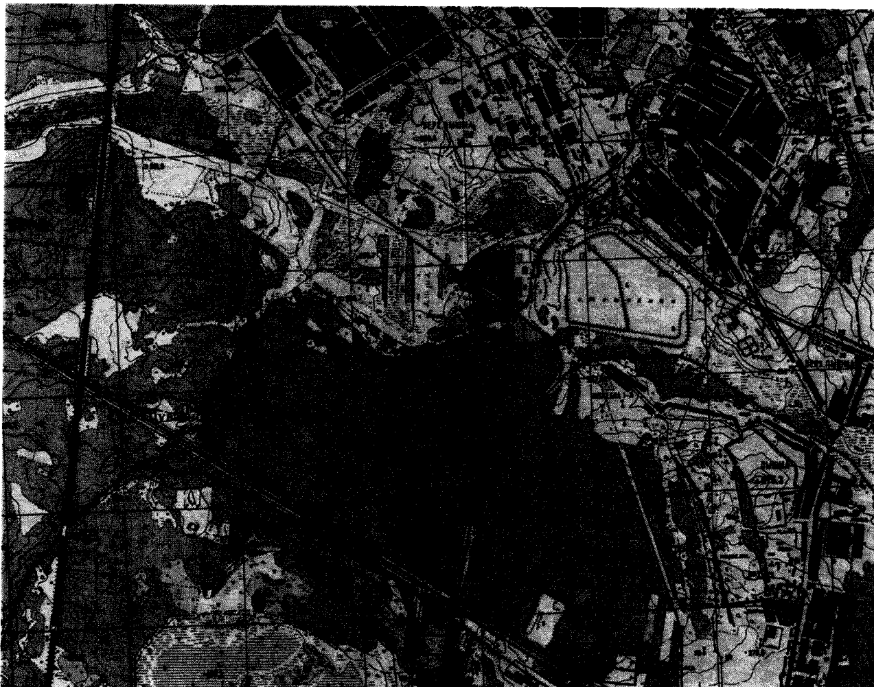
● – «Стоянка Шувакишский Исток VIII»