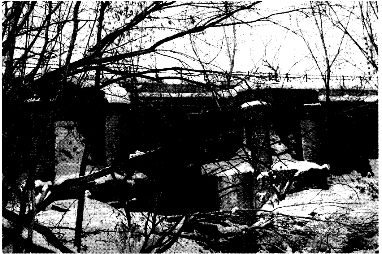
Фотографическое изображение объекта культурного наследия (февраль 2017)